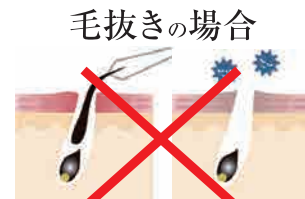
毛抜きの場合 ムダ毛を無理やり引っ張る毛抜き処理は毛穴や肌へのダメージが大!!