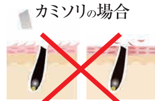
カミソリの場合 肌表面の必要な角質まで削ってしまい、肌のバリア機能を弱めます。

カミソリや毛抜きでムダ毛を処理すると肌を傷めてしまいます。せっかくムダ毛がない肌でも、荒れていては理想の素肌ではないはず。「パイナップル豆乳除毛クリーム」は肌にやさしくムダ毛をとって、輝くツルスベ肌に導きます。